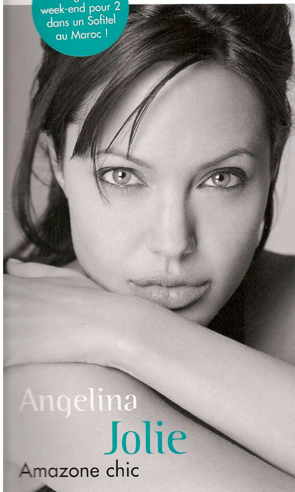
Angelina Jolie Amazone chic

Gagnez un grand week-end pour 2 dans un Sofitel au Maroc !